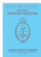
DNI (libreta celeste)