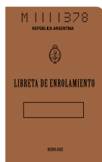
Libreta de Enrolamiento