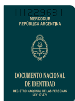
DNI (libreta verde)